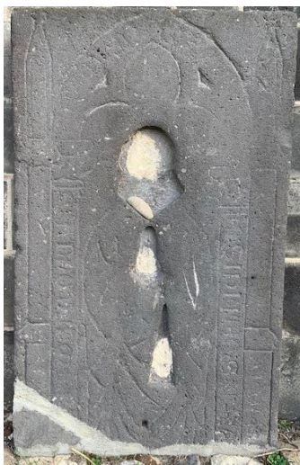
pierre tombale devant côté ouest de l'Eglise à quelle famille appartenait elle ?